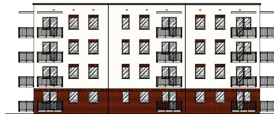
Poglądowa elewacja południowo-zachodnia