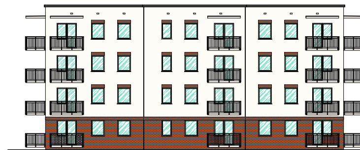
Poglądowa elewacja południowo-zachodnia